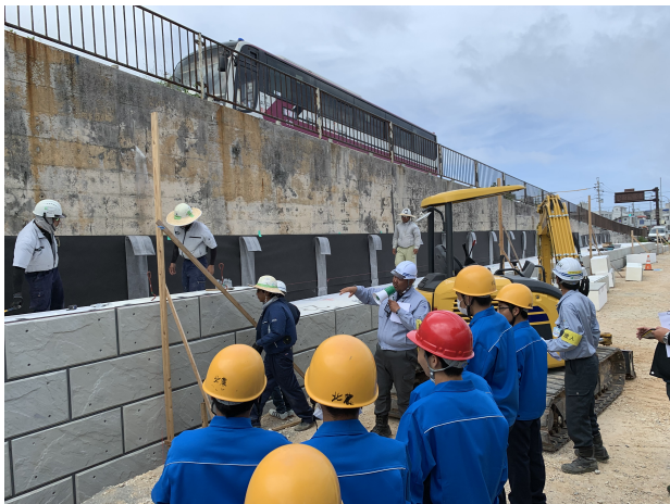
【後継者育成】