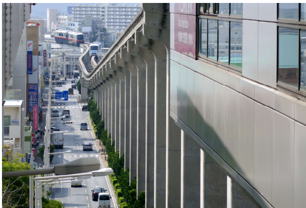
〈造〉【ゆいれーる鍵盤】 中村 悦子