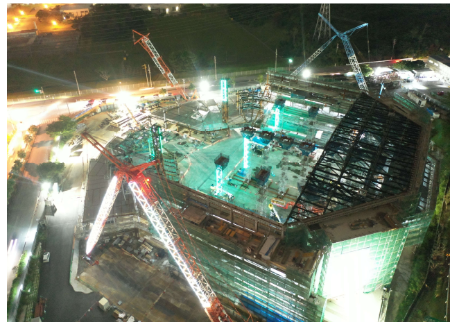
【1万人アリーナ】