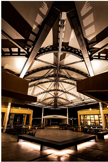
【おいでやんばるの森ビジターセンターへ】