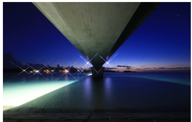
〈造〉【コロナ禍・癒やしのひととき (撮影：伊平屋村)】 仲地 慶師