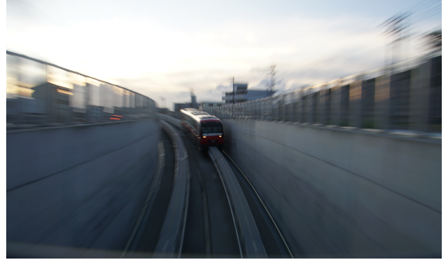
【進む時刻(とき)(撮影：那覇市)】