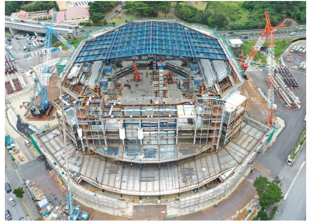
【県内初！1万人アリーナ】